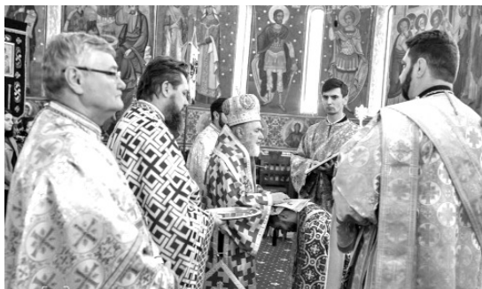
fapt, este pentru Dumnezeu”.

Îmi închei expunerea despre preoția în gândirea efremană tot cu un cuvânt al Sfântului Efreem: „Și acum, fraților, trăiți preoția în curăție, imitând pe Moise, pe Aron și pe Eleazar (Num. 27, 2)”, dar îndrăznesc să completez adresându-mă atât teologilor care se pregătesc pentru slujirea pastorală, dar și preoților care abia au pășit în această slujire – Acum fraților, încercați să trăiți viața în curăție pentru a câștiga buna îndrăzneală și prin aceasta să ne apropiem cu uimire și cu dragoste față de înfricoșătoarea și preamnată taină. Părintele Ioan G. Coman ne spune că „alegerea pentru preoție e un act al dragostei lui Dumnezeu, de care cei aleși se înspăimântă că nu-i pot corespunde. Din momentul acceptării preoției însă, ei depun eforturi neîncetate și se mistuie în lucrarea de dragoste și de jertfă pentru credincioșii lor, lucrare care, de